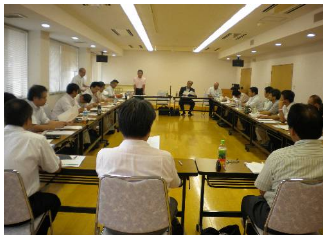
福岡地域労福協の研修会風景（2010年9月）

福岡県労福協は、年間活動計画にもとづき、県労福協主催で県内7地域労福協での役員研修会を企画し、県労福協は会長、副会長、事務局長の三役がその対応にあたりました。