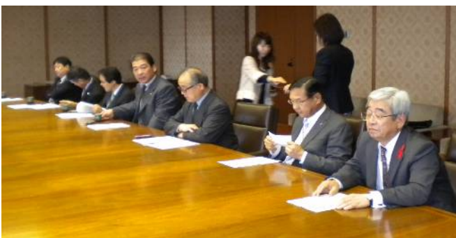
要請行動に参加した県労福協役員の方たち