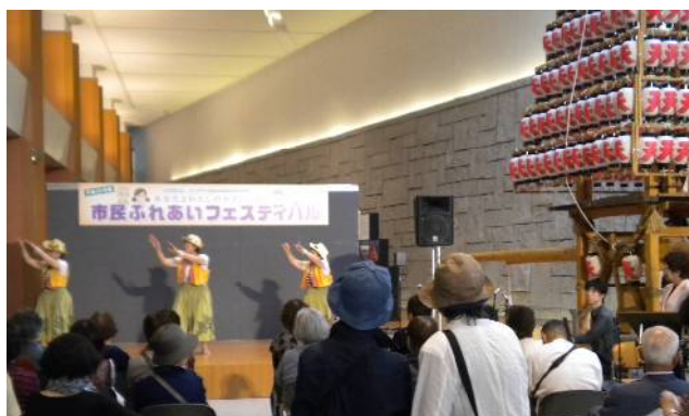
市民ふれあいフェスティバルの風

※北九州地域労福協以外の県内6地域労福協でも、障害者施設等へ物品などの寄贈を行っています。