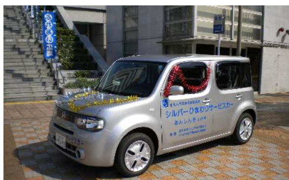
8台目となる送迎サービスカー