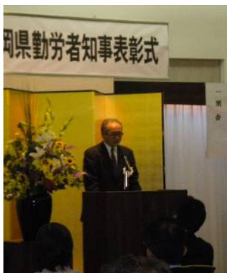
来賓として祝辞をする高島会長

11月24日、福岡市博多区吉塚の博多サンヒルズホテルにおいて、平成23年度福岡県勤労者知事表彰式が行われ、福岡地区5名、北九州地区9名、筑後地区7名、筑豊地区5名の総勢26名の方が表彰を受けました。