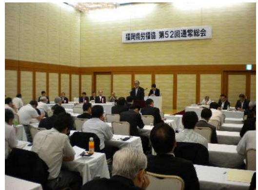
第52回通常総会・風景/福岡サンパレス

議案審議では、第1号議案から第3号議案(役員改選案)までが審議され、原案通り満場一致で可決・承認され、第52回通常総会は14時50分、無事、終了しました。