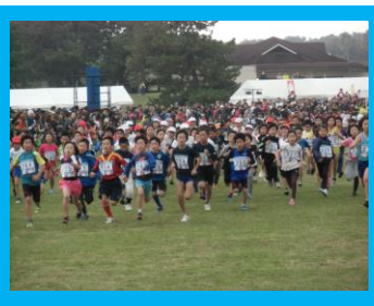
小学3年男子1kmのスタート