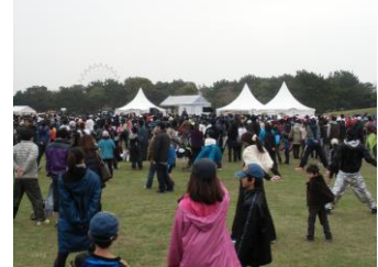
インストラクターの指導で準備体操