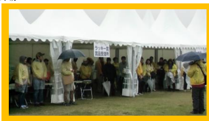
早朝8時、各セクション責任者のミーティング