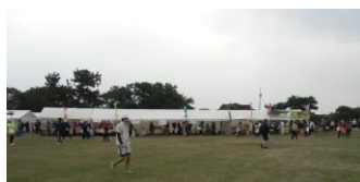
さわやかフェスタ会場

本年も競技・運営に170名のボランティアのご協力を頂きました。前日の参加賞袋詰め作業から当日早朝からのミーティングや競技サポートにご奮闘頂きました。厚く感謝を申し上げます。