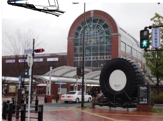
新しくなったJR久留米駅前の風景

エリア内の久留米市は、2005年の合併により人口が30万人を超え2008年4月1日に中核市に移行しました。ブリヂストンの創業地でもあり、ゴム加工品メーカーの工場が多く所在しています。近年は、ダイハツ工業の子会社であるダイハツ九州の軽自動車専用エンジン工場などが進出し、北部九州における自動車産業集積化の一翼を担っています。