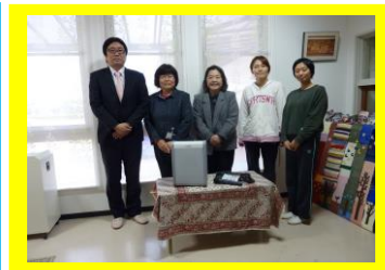
京築・田川地域労福協