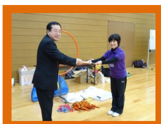
北筑後地域労福協