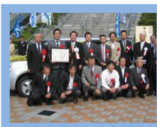
北九州地域労福協

2012年度の取り組みでは 7,382,792円の浄財が 集まり、県内22施設へ 必需品を寄贈しました。