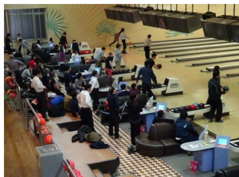
ボウリング大会の風景

昨年度は北筑後地域労福協の新たな取り組みとして、5月にチャリティゴルフ大会、12月に交流ボウリング大会を実施しました。チャリティゴルフ大会には36名の方が参加し、皆さんから募ったカンパは福祉募金として活用させていただくことができました。また交流ボウリング大会は、年末の忙しい時期にもかかわらず48名の方に参加いただき、健康増進と会員相互の交流を深めることができました。