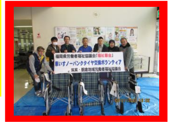
筑紫・朝倉地域労福協