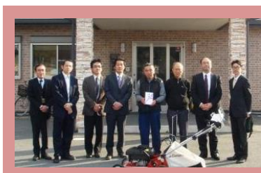
南筑後地域労福協