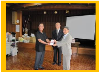
遠賀川地域労福協