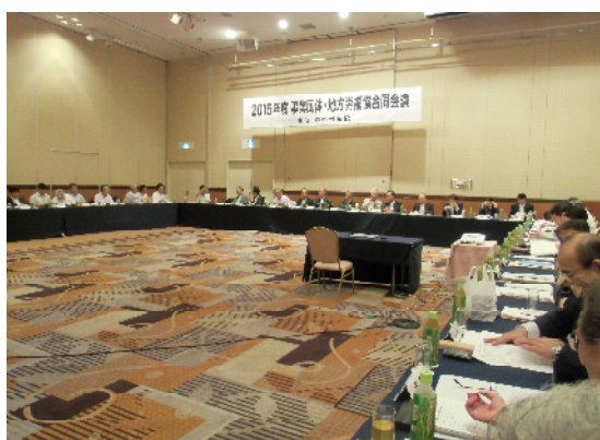
第1日目の会場風景

済・日本生協連(1日目に報告)・労協連の4団体から報告があり意見交換を行いました。最後に全体のまとめを行い2日間の会議を終了しました。