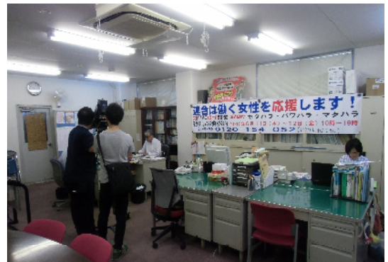
マスコミが取材中の相談窓口