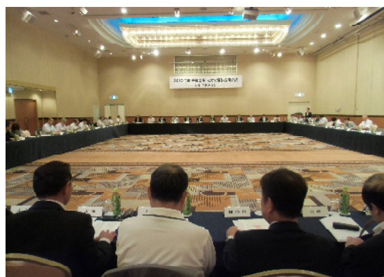
第2日目の会場風景