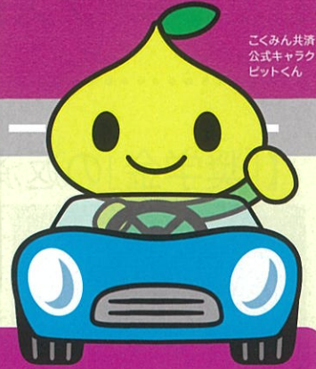
こくみん共済coop 公式キャラクター ビットくん