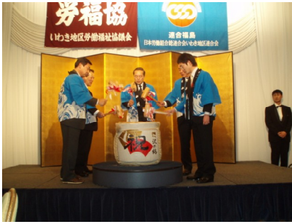
来賓の方々による鏡開き