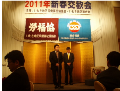
鳥居作弥県議候補予定者の挨拶