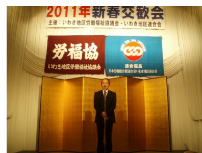
吉田泉衆議院議員の祝辞