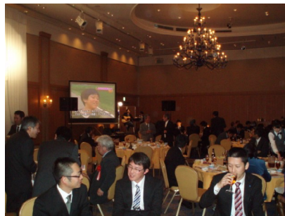
年頭の挨拶を交わす出席者