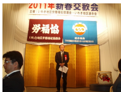
影山連合福島・県労福協会長の挨拶