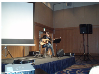
菊池章夫コンサート