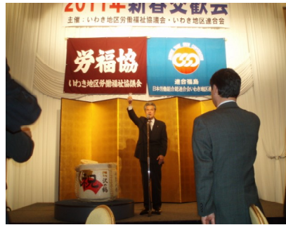
大和田副会長の音頭で乾杯