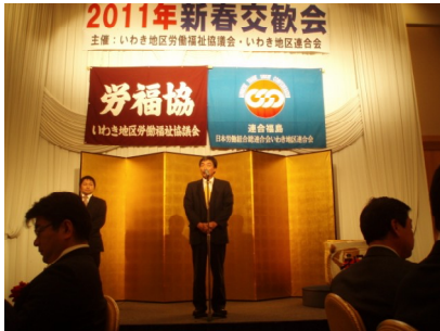
古市三久県議候補予定者の挨拶