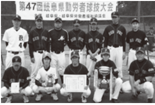
優勝 ● 大垣市労連