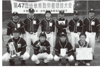
準優勝 ● 岐阜乗合自動車労働組合