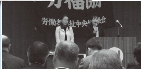
◀初めての女性議長団