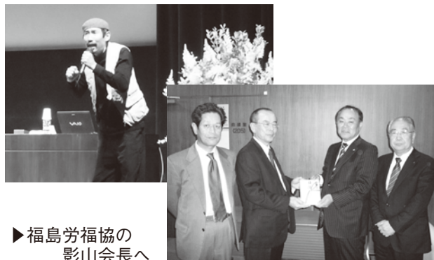
▶福島労福協の影山会長へ

会場での募金額は70,448円でゴルフの募金と合わせて東日本大震災の義援金として、11月25日に北部労福協(代表・福島労福協)へ寄贈しました。