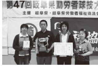
優勝 ● カワボウ労働組合