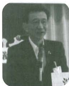
伏屋岐阜市商工観光部長