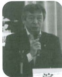
三尾連合岐阜会長