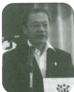
林県労働雇用課長