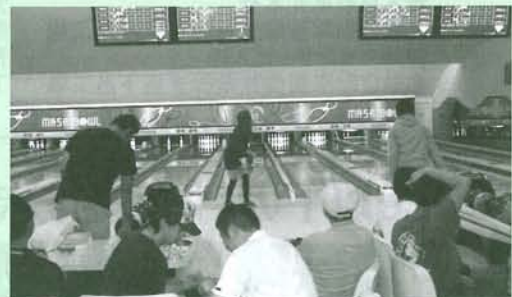
▲昨年のボウリング大会の様子