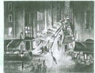
▲45回厚生労働大臣賞

【表彰】 審査会において、種目ごとに優秀な作品を決定し賞状・賞品を贈呈します。 (厚生労働大臣賞、知事賞、労福協会長賞、奨励賞) 表彰式は9月8日(土)に行う予定です。