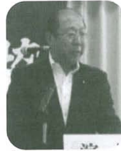
豊田全労済県本部長