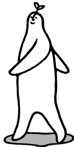
相談からはじまる、最初の一步。