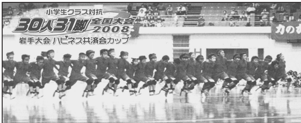
小学生クラス対抗 30人31脚 全国大会 2008 岩手大会 ハビネス共済会カップ