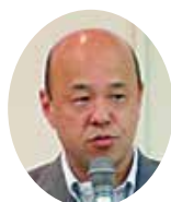
(こくみん) 長崎支所長