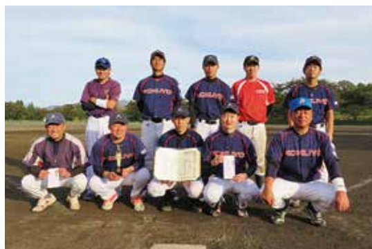
準優勝 岩手オフィス用品コクヨクラブチーム