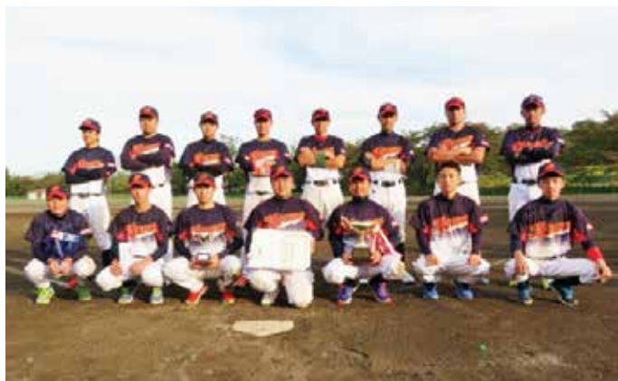
優勝 トヨタ紡織東北(株)チーム