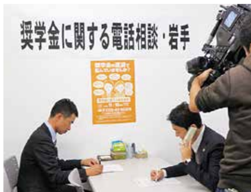
奨学金全国一斉相談

また、労働運動・労働者自主福祉運動が果たしてきた役割をあらためて学び、労働運動および共済運動の重要性を再認識する中でその理念を分かち合い、連帯・協同・友愛・絆の意味を共有するための出前講座を県内7地区で開催しました。