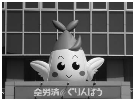
マスコットの「ぐりんぼう」

「全労済ぐりんぼう」の各窓口では、「助け合いの生活協同組合」として、20代の若いシングルライフの方から、ライフステージが大きく変化する40代の方、またご退職を迎えられセカンドライフを過ごされている方等、さまざまなライフステージに合わせた保障設計のアドバイス活動を実施しています。 また忙しくて窓口に行けない方、じっくり話を聞きたい方も、まずはお気軽に「全労済ぐりんぼう」までご連絡ください。 全労済ぐりんぼうでは、お客さまとの対話を大切にし、保障のことから暮らしのことまで、「助け合いの輪」を広げていく活動を展開しています。