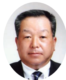
一般社団法人鹿児島県労働者福祉協議会理事長