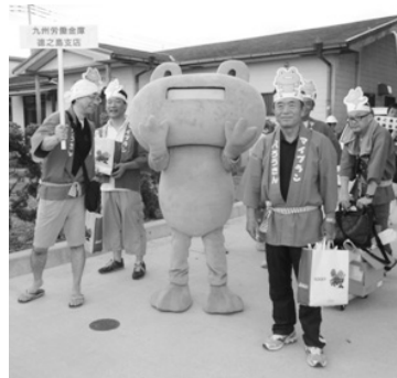
パフォーマンス部門で参加!