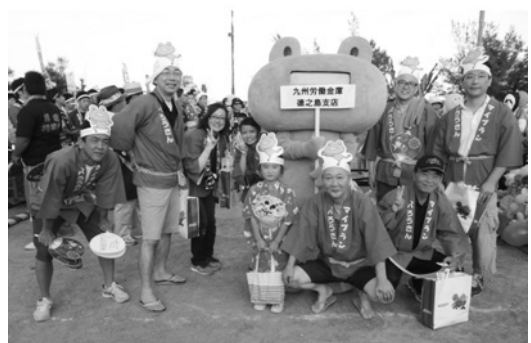
ついにツカエルさん、デビュー!