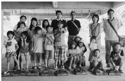
親子で思い思いの箱庭を作りました

夏休みに入った最初の週末に親子でふれあう体験型の講座を、7月24日（金）～25日（土）の1泊2日で開催し、9家族、23名（大人12名、子ども11名）に参加して頂きました。 1日目は、今年終戦70年を迎えることから、南さつま市加世田にある「万世特攻平和祈念館」を見学しました。 展示品の中の特攻前日に撮影された写真には、子犬を抱いて笑顔を浮かべている無邪気な17歳の青年の姿があり、翌日は特攻隊員として尊い命を国へ捧