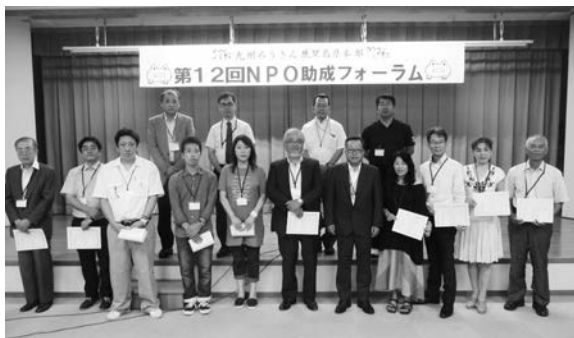
助成団体および審査委員のみなさん