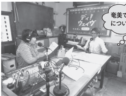
末広市場ディ！放送所で出演した喜納推進委員長

また、地元の奄美地域推進委員長や指定整備工場鹿児島県協議会会長も出演し、それぞれの活動を紹介していただきました！