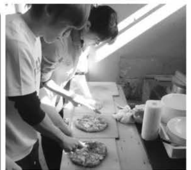
やや緊張しながら仕上げは念入り!

12月4日、鹿児島支店は鹿児島市で鹿児島・日置/指宿地域青年・女性推進委員会イベントを開催しました。