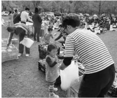
家族サービスもバッチリ(^^)