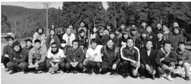
参加された皆さん、ありがとうございました

れ、マルゲリータ、豚味噌、塩こんぶ、ミックス、クリーム、クワトロ、リングゴなどのピザを作り、互いに試食しながらさまざまな味を堪能しました。 異なる職場のメンバーでチーム編成し、一緒にピザ作りをしたことで互いの交流やろうきんの商品・サービス内容の浸透が図られ、ますますろうきん運動の推進に役立てることができました。次回は、もっともつと多くの方々が参加できるように企画していきます。