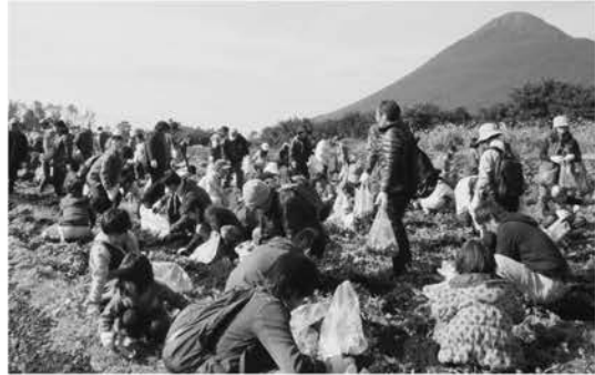
晴天に恵まれ絶好のいもほり日和!