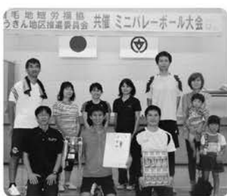
優勝・西之表市職労B、準優勝・九電労組、3位・西之表市職労A、4位・JP労組

熊毛地域労協と労金推進委員会の共催によるミニバレー大会を10月29日(土)、西之表市民体育館で開催しました。