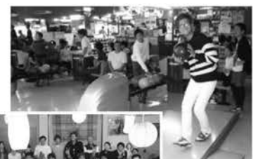
▲会員交流が図られました

当日は、ボウリング大会を17時にスタートし、会員混合でのチーム編成を行い2ゲームを楽しみました。ゲーム中は、大きな笑い声や拍手、ハイタッチをする様子も見られ、普段なかなか他の職場の人との交流を図れない中、参加者同士の親睦を深める貴重な機会となりました。