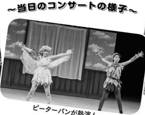
ピーターパンが熱演!