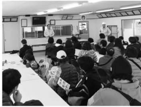
南西糖業徳和瀬工場にて

このイベントは、推進委員会として初の試みでしたが、募集定員50人を超える参加申し込みがありました。それぞれの工場では、今回のためにわざわざ担当職員の方々が手作りの案内パンフレットを準備され、原料から商品化されるまでの工程を分かりやすく丁寧に説明いただき、参加者は日ごろ体験できない機械だらけの工場内の様子に終始驚きの連続でした。