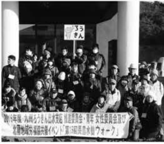
皆さん、お疲れさまでした

をはじめ、労金の商品紹介や労働協の歴史などを説明しました。沿道いっぱい咲いているスイセンや、遠くに島原を望むきれいな海に感動しながら、約1時間30分かけて、ゆっくりとウ