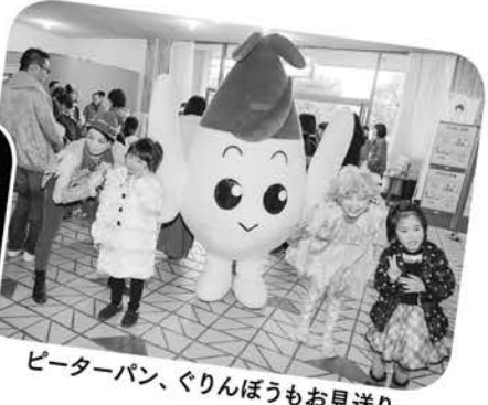
ピーターパン、ぐりんぼうもお見送り

を連発、違憲性が問われる選別と分断、米国の不利益は一切認めない排他的言動、自給自足を思わせる継続性のない経済政策、国際的支援など眼中にない協調・協同欠落の外交。果たしていつまで、どこまで続くのか。▼英国のEU離脱やトランプ現象など、目先の利益に走ってしまふ「大衆迎合主義」が蔓延し、世界中が自国中心の保護主義に傾き、経済摩擦と共に民主主義や秩序が揺らぐことが懸念される。▼日本政府も安全保障や基地問題、貿易など課題は山積している。毅然と対峙し主張しなければならぬ。▼世界では領土・宗教・民族・イデオロギー等々において、暴力的過激主義が横行し、テロや紛争が常態化している。今や世界の大半でテロの脅威度が高まり、昨年のテロと認められる件数は約1・5万件、死者数約3・2万人である。▼また格差拡大は留まることなく、世界人口の下層より半分に相当する約47兆円の富を、たった8人が保有している現実がある。▼2月は日本においては節分、鬼を退治し無病息災・家内安全を祈る風習である。世界の鬼退治はいかに!