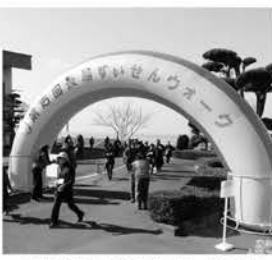
汗ばむほどの好天に恵まれ

今回は、推進委員会・青年女性推進委員会および北薩地域労協との共催で、事前6kmコースの参加者を募集したところ、早い段階で定員の100人の申し込みがあり、多くの人に参加いただきました。