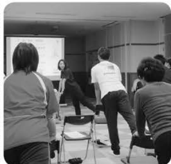
童謡に合わせてゆっくりと...