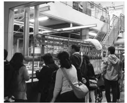
にしかわ酒造にて

イベント終了後に行ったアンケートでは、「工場内で働くお父さんたちの姿が頼もしく思えた」「立派な基幹産業を持っている徳之島に誇りを持った」など、心温まるお礼のメッセージを頂き、充実した会員還元イベントでした。