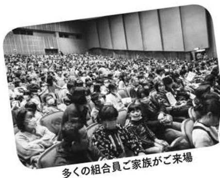
多くの組合員ご家族がご来場

第675号 〔発行所〕 (一社)鹿児島県労働者福祉協議会 〒890-0064 鹿児島市鴨池新町5-7-603 ☎099-254-3832 〔発行人〕 森田 周一 〔印刷〕 南日本新聞開発センター 〔編集〕 県労福協、九州労金、全労済、生協連 ☆労福協だより 毎月15日に更新!! 鹿児島 労福協 検索