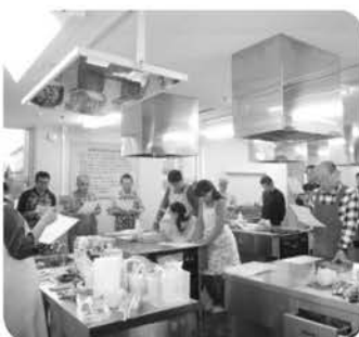
レシピの説明を一生懸命に聞く参加者

作りに励んでいました。また、参加者からは野菜をみじん切りにしたり、ナンの生地を一生懸命こねたりと楽しそうに作っていました。最後は、出来上がった料理をおいしくいただき、後片付けをして終了しました。