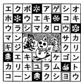
答え「ユキゲショウ(雪化粧)」