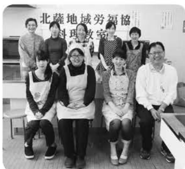
食べ過ぎた? おいしかった(笑)

最後に野菜を1日350gは食べましょうという講師からの話の後、全員で会食し、おいしくいただきました。