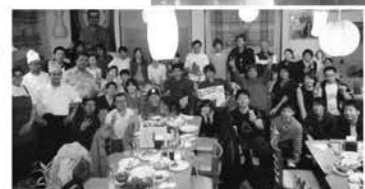
懇親会は大盛り上がり!

ゲーム終了後に開催した学習会・懇親会では、ろうきんの成り立ちや銀行との違いなどについて学習した後、懇親会でボウリングの表彰式やジャンケンゲームを行い、大いに盛り上がりしました。