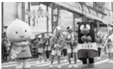
黒豚くん/ユニオニオン君

また、県職労本部様より12人、南日本総合サービス分会様より3人、全農林様より1人、南日本新聞開発センター様より1人、計17人の会員さんの参加、ありがとうございました。