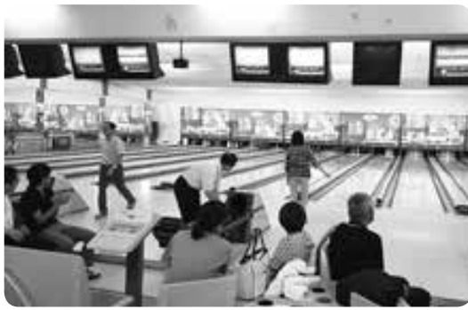
熱戦が繰り広げられました

当日は地域内のさまざまな職場より41人の参加をいただく中、上位入賞者には豪華景品も用意され、熱戦が繰り広げられました。大会終了後は表彰式を兼ねた懇親会が行われ、個人の部上位3人は電力総連が占めるなど大いに盛り上がりしました。懇親会では普段なかなか他の職場の方と交流を図る機会のない中で参加者同士がお互いの親睦を深める貴重な機会となりました。