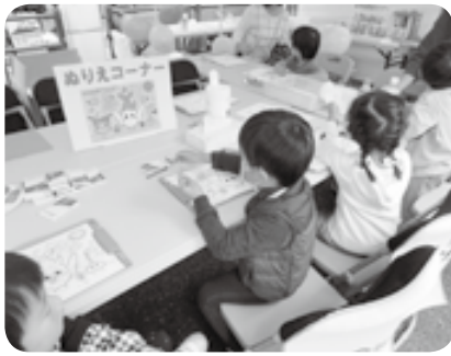
今年もぬり絵で大繁盛♪