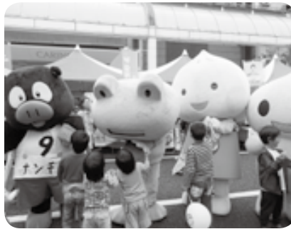
素敵な仲間たちが来てくれました★

お子さまが作成されたぬり絵は、11月下旬から、ぐりんぼう鹿児島で展示する予定ですので、ぜひ店舗へお越しください。