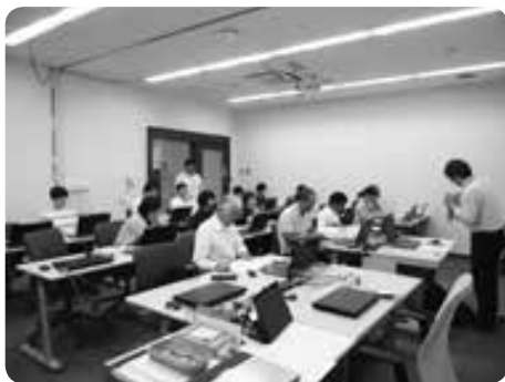
熱心に聞き入る参加者のみなさん

ンクシンキーを活用した入力テクニックや、文字の装飾などの文書作成テクニックなど、また中級では、表のレイアウトなどの表作成、オブジェクトの操作・ページ装飾など実践を踏まえながら学びました。受講者は先生からテキストにはない役立つ知識を教えてもらうと、すぐさまテキストに書き入れるなど、熱心に取り組む姿が見られ、パソコンに対する意識の高さが見えました。