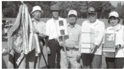
優勝した指宿Bチームのみなさん