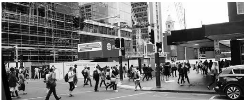
町の至る所で高層ビルの建築が進むオークランド市内

最後に今回の貴重な経験を自分の身につけるためにも、もと日本の福祉について勉強しなければならぬと感じました。