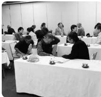
「褒められると照れますねー」