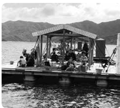
「釣れないかなあー」

前回(4年前)のほとんど釣れなかった魚釣りよりは釣果が良かったものの、苦しい思い出を払拭しきれずに帰路に着くことになったので、次回こそは潮の満ち引きを念頭に入れた日程調整を行います。ぜひ、次回にご期待ください。(大変申し訳ないので申し添えますが、この日行った『釣りイカダ宇検』は普段、アジ・スマガツオ・タイなどがたくさん釣れます)