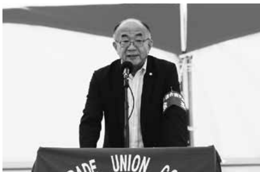
連合鹿児島森田会長あいさつ