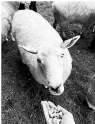
ニュージーランドの羊