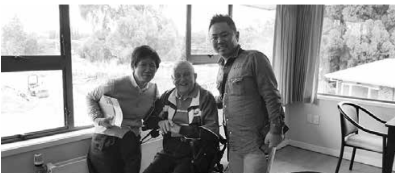
なんて素敵な日でしょう

福祉国家といわれる国も一朝 一夕でなく紆余曲折あり現在に 至り、今も進化していると思う。 全ての人が大切にされる社会 を目指して労働運動、福祉運動 があると改めて感じた視察でし た。派遣してくださった皆さま、 同行してくださった皆さまあり がとうございました。