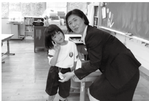
ホイッスルありがとう!!

らホイッスルを首からかけていくと、児童らは喜んでり恥ずかしがったりとさまざまな表情で受け取っていました。受け取った児童からは、「笛がかわいい」、「ありがとうございます」というお礼の言葉がありました。未来を担う子どもたちへの支援、子どもたちを犯罪から守る活動として、この取り組みは今後も継続し、地域の防犯にも協力していきたいと思っています。