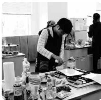
「調味料の分量を間違えないでね!」

「皆さんいかがでしたか」の講師の問いかけに、「楽しかったです」「家でも作って家族に食べさせてあげたいです」という嬉しい感想をいただきました。