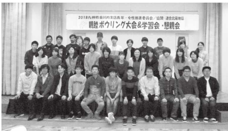
みんな揃って「ハイ! ポーズ」