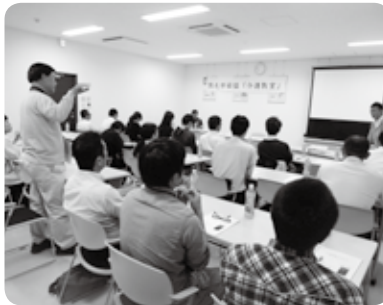
要介護者を抱える参加者からの質問

また、介護保険導入の意義からこれまでの改正の経緯を踏まえ、現在の介護保険制度は要介