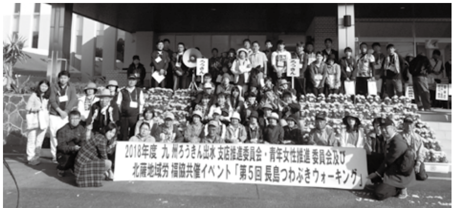
参加者一同「ハイ、チーズ!」