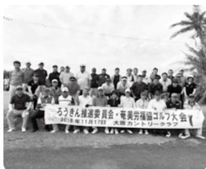
プレー前に全員集合

(淵上グループ互助会) *ルールについては、誰にでもチャンスがあるようにダブルリペア方式(ハンディは36打切りなし)