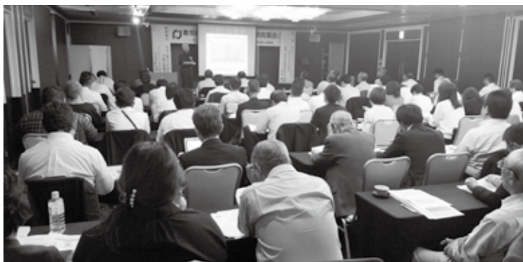
研究集会のようす「防災・減災」について学ぶ参加者