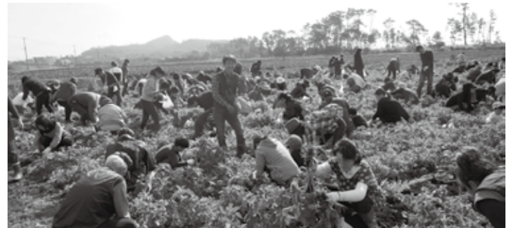
晴天に恵まれ絶好のイモ掘り日和!