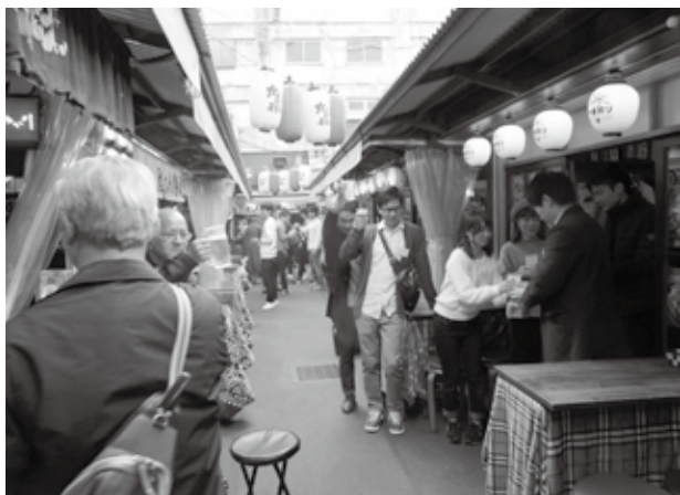
屋台村で「はしご酒」乾杯!!