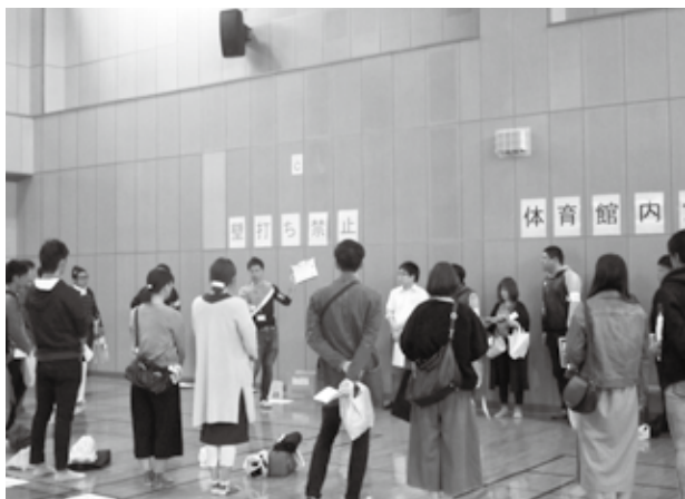
前門職員よりオリエンテーション

今回のイベントは、大変多くの方に参加をいただき、イベントの目的であった職場・業種を超えた参加者間の交流、またろうきんのゆるキャラ「ツカエルさん」を知ってもらった絶好の機会となりました。本当にありがとうございました。