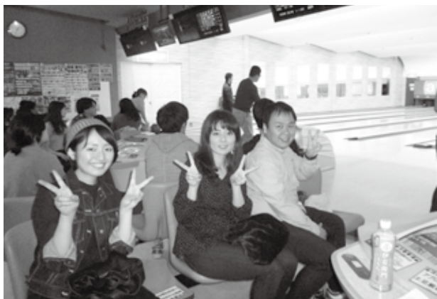
スコアよりも仲間づくり

シア串木野へ移動し、学習会・懇親会を行いました。学習会では、話題の「育てる年金 iDeCo」をテーマとして、個人型確定拠出年金に関する知識をお互いに深めました。懇親会では、ボウリング大会の表彰式や景品贈呈を行い、職場や地域の枠を超えた参加者同士の親睦を深める貴重な機会となりました。