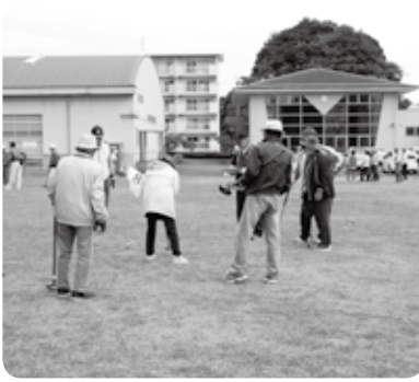
一打一打、真剣にプレーする参加者

ほとんどの参加者がマイステック・マイボールを持参し、日頃の練習の成果か、ホールインワンもたくさん出て、1人で2回出した人もいました。優勝は、2回のホー