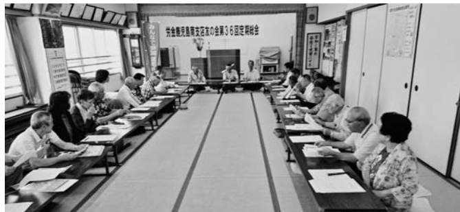
南支店友の会総会の模様