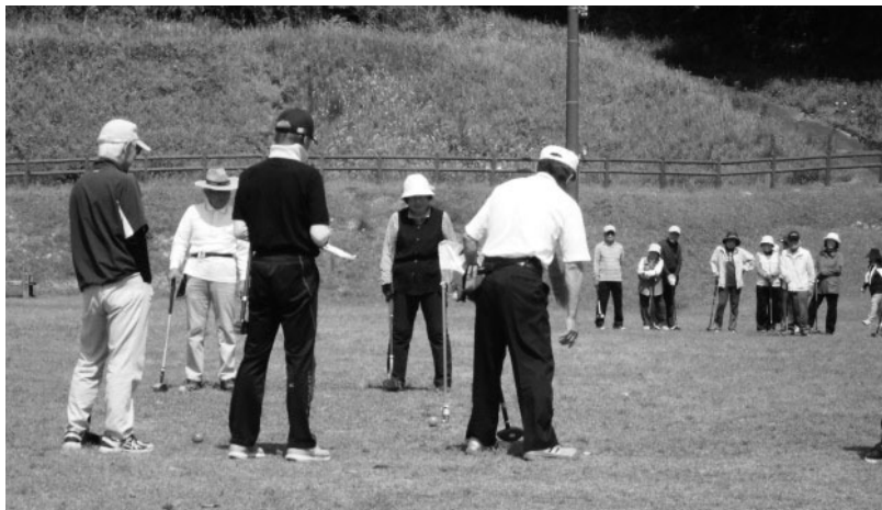
総会終了後のグラウンドゴルフ

総会終了後に毎年開催されるグラウンドゴルフ大会は、陶夢ランドにて好天の中で開催されました。結果は優勝は稲