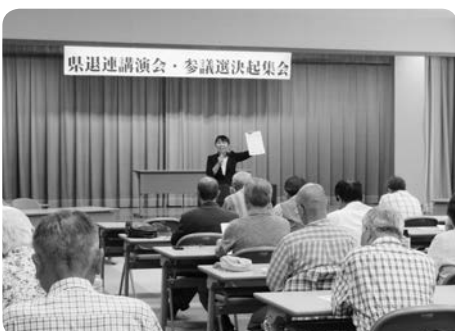
身近な課題に聞き入る参加者

やっておきたい課題として、①もしもの時のために交友関係のリスト整理、②法定相続人が誰か、③④所有している不動産と金融資産の確認、⑤⑥介護情報と終末期医療の希望、⑦遺言書の作成など10項目について、自身の体験も交えて具体的な講演をしました。参加者からは「さっそく実行しなければ」との声も聞かれました。