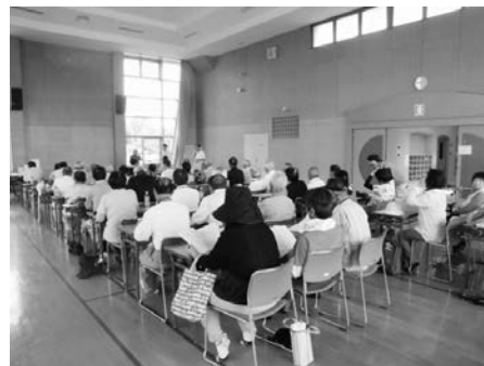
陶夢ランドホールにて総会