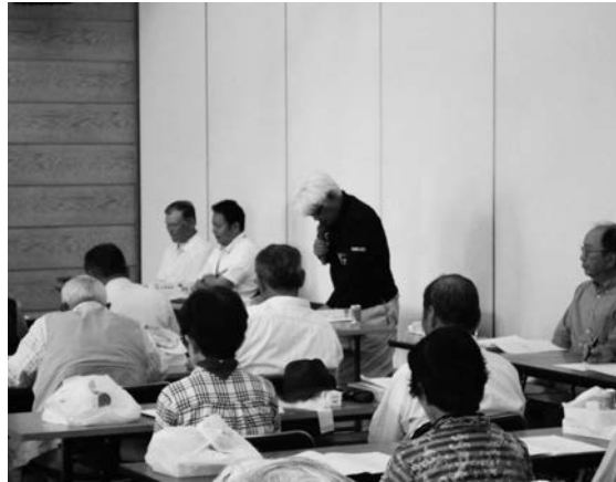
大口支店友の会総会