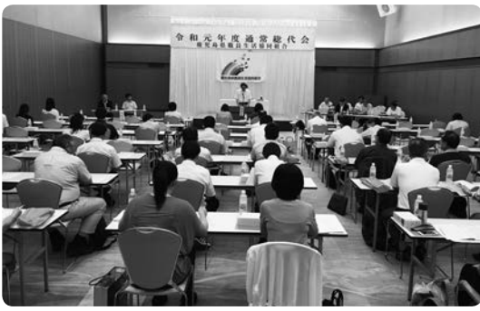
令和元年度通常総代会の様子

このあとに開催された第1回理事会で、副理事長1人の辞任に伴う新副理事長の後任を選任