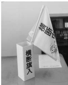
寄贈した横断旗と横断旗ケース

こくみん共済coop（全労済）は、みんなですすめあい、豊かで安心できる社会づくり」という理念にもとづき、地域社会に貢献する活動を展開しています。豊かで安心できる社会が形成され継続するために、「防災・減災」「環境保全」「子どもの健全育成」の活動を重点分野と位置づけ、さまざまな社会貢献活動に取り組んでいます。取り組み内容など詳しくはこくみん共済coop（全労済）ホームページをご覧ください。