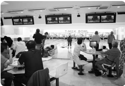
ボウリングを楽しむ参加者

連合鹿児島地域協議会と鹿児島地域労働者福祉協議会は共催で5月29日（水）、第27回ボウリング大会を鹿児島市のT-MAX BOWLで開催し、40組・120人が参加しました。