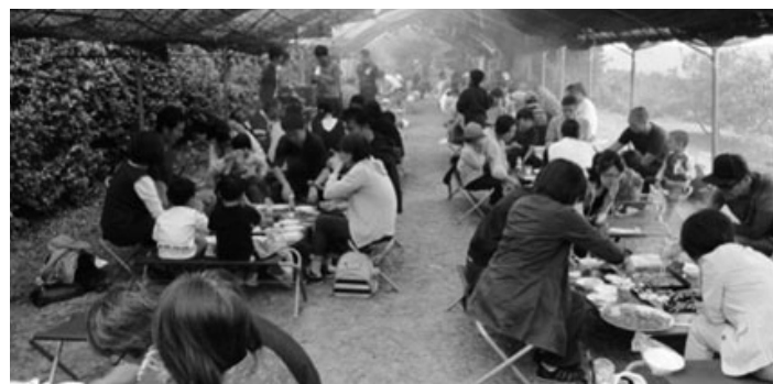
バーベキューで楽しく交流♪

みかん狩りで参加者は農園の方からアドバイスを受け、試食をしながら収穫を楽しみ、バーベキューでは、家族や職場同士で交流を深めていました。青空の下、アルコールを楽しむ人、食後にはさみを持つてみかんを狩り、デザート代わりに食べ歩く人、農園を駆け回る子どもたちなどそれぞれがイベントを満喫し好評のうちに終了しました。