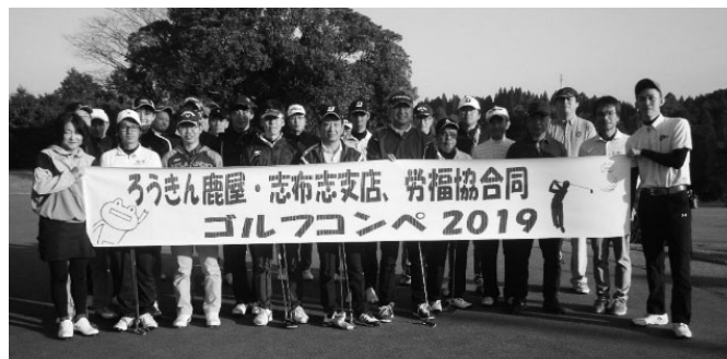
参加者全員で記念撮影！

は参加者に笑顔があふれ、楽しく交流を深める一日となりました。結果は左記の通り。 《団体》 優勝…鹿屋市職労チーム 2位…JP労組大隅支部チーム 3位…教職員チーム