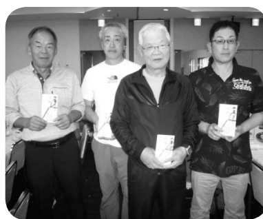
団体の部での優勝した建設技能者組合のメンバー

参加者は快晴の下プレーを楽しみ、競技はダブルペリア方式、ハンディ上限打ち切りなしで実施されました。個人の部の優勝