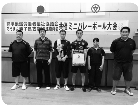
優勝の南種子町職労Aチーム

当日は、19チーム166人が参加し、見事なチームプレーや運動不足からか珍プレーも続出。産別、同僚、家族を超えて会員が親睦を深め、爽やかな汗と笑顔あふれる楽しいひとときとなりました。