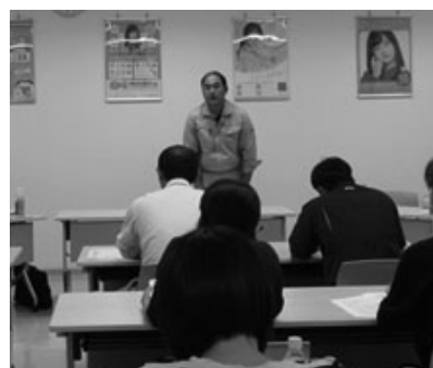
美坂推進委員長のあいさつ

会議終了後の懇親会では労金運動をさらに推進すべく参加者が遅くまで話が弾ませ、交流や絆を深めていました。