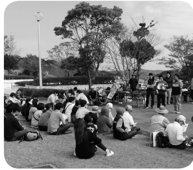
真面目に聞き入る参加者の皆さん

ろうきん出水支店推進委員会と青年女性推進委員会、北薩地域労協は10月13日(日)に学習会を開催し、88人が参加しました。