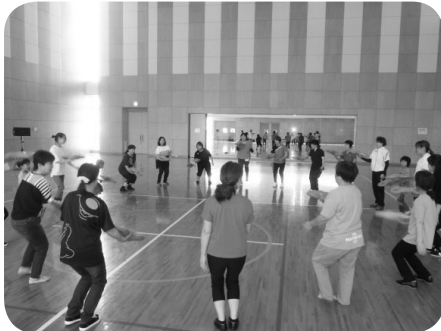
輪になって「ベル」を投げてキャッチ！

日本3B体操協会の提唱する3B体操は、3つの用具(ボール、ベル、ベルト)を使用し、老若男女問わず誰でも楽しめるように考案されたものです。音楽に合わせて無理なく体を鍛えられる、当日は小さな子どもも飽きることなく夢中で体を動かして、最後まで楽しんでいました。無理せず心身がリラックスする程度の動きで、全身を鍛える効果がある3B体操。特に運動不足が気になる参加者は、集中