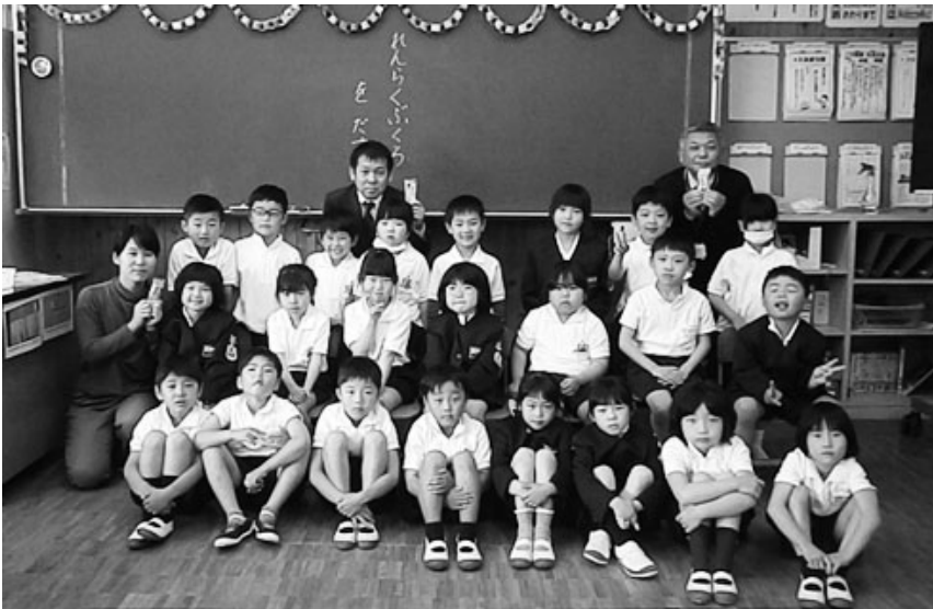
蓬原小学校での記念撮影

志布志支店は志布志市立蓬原小学校で「ツカエルさん防犯ホイッスル」の贈呈式を行いました。毎年行っているこの取り組みは本年、志布志支店管内の2市1町の新小学1年生全員に贈呈しました（志布志市314人・曾於市269人・大崎町85人）。贈呈式では、窪支店