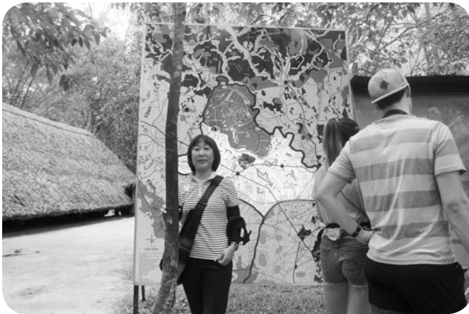
クチ地下トンネル歴史遺跡前で