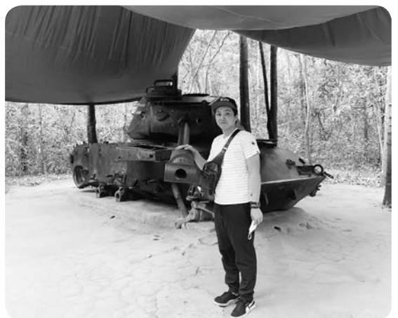
壊れた戦車と記念の1枚

今回、第25次海外視察の一員としてベトナムを視察する機会をいただきました。ベトナムと聞いて思いつくことは、「ベトナム戦争」と「ベトナム・ドクちゃん」ぐらいであった私が、今回の視察に参加したことで、ベトナム戦争の悲惨さやベトナムの現状を少しでも理解する良い機会となった。