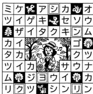
答え 「シンリョク(新緑)」