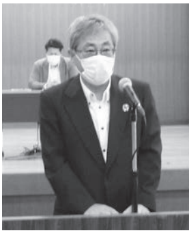
榮留理事長あいさつ

鹿児島県労働者福祉協議会第60回通常総会を開催するに当たり、一言ご挨拶申し上げます。昨年は、4月後半から5月前半まで、平成・令和と2つの時代をまたいだ10連休がありました。今年、打って変わり、感染症との闘いを「自粛」で過ごす、ゴールデンウィークとなりました。様々な業種の方々が、感染症拡大防止に最前線で闘い、生活