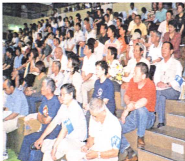
北方領土返還集会