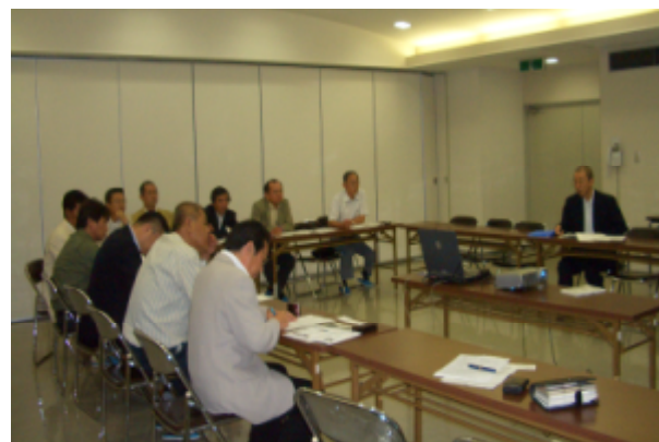
労福協東三河支部のみなさん

クリニック会議室でパワーポイントによる生き生き夢くらぶの紹介のあと、ふれあいかんを見ていただきました。メンバーの方で「私は家を建てるとき、近所との係わりが無い場所を探してもらいました。生き生き夢くらぶのお話を伺って今とても後悔してます。」と感想を述べられました。