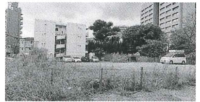
▲新労働会館建設予定地 ・中央区九品寺1丁目17-9 ・右の建物は熊大病院

ンビニ入店、南側に会館駐車場、2階に連合熊本と労働団体などの事務所、3階に団体事務所、大会議室など）が確認され、10月中旬に設計会社と契約する予定で、来春に建設会社と契約を行い、2021年3月までの完成を目指しています。