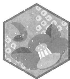
第4回加盟団体代表者会議

2010年度活動方針は会員団体や乙訓地区の労働団体と連携を密にして、未加入団体の加入促進を図り、団体や個人が多数参加できる魅力ある協議会を目指す事を提案し、活動報