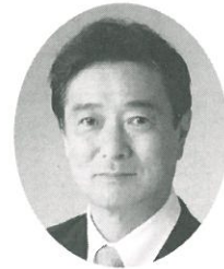
京都労働者福祉協議会