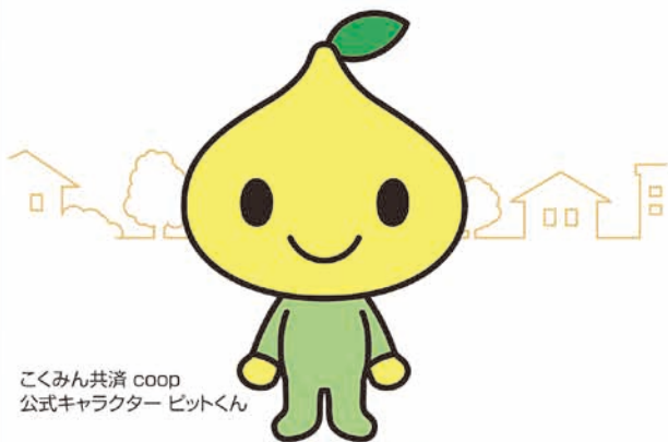
こくみん共済 coop 公式キャラクター ビットくん