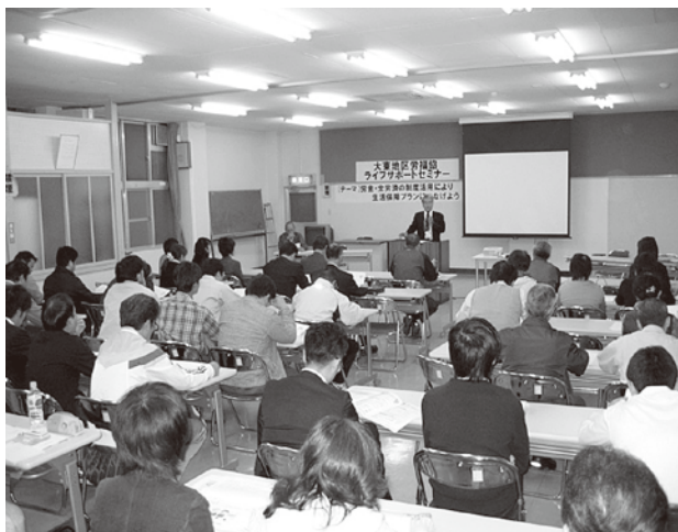
▲ライフサポートセミナーで受講する参加者

全労済は、「保障設計運動について」の講義、参加者50名は熱心に聞き入るなど有意義なセミナーであった。