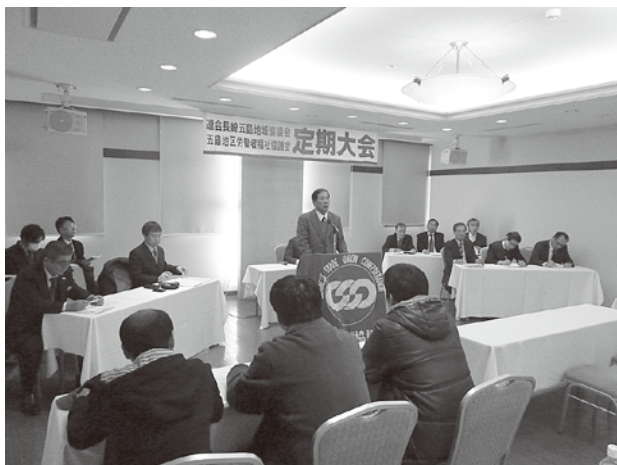
▲五島地区労福協第21回定期総会

■五島地区労福協は、12月22日(土)はたなかにおいて第21回定期総会を開催。次年度運動方針が満場一致で承認された。