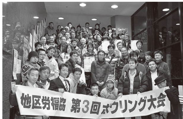
▲佐世保地区労福協ボウリング大会参加者の面々