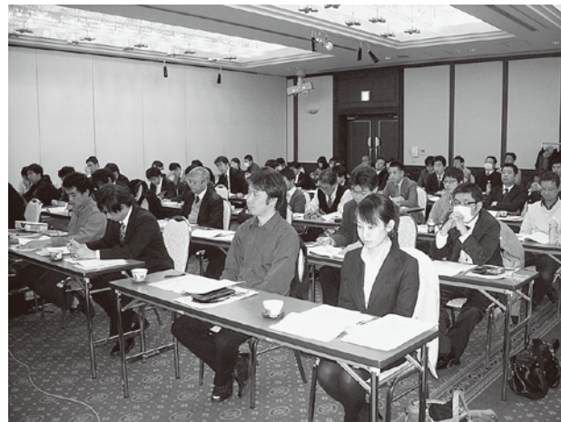
▲熱心に聞き入る参加者