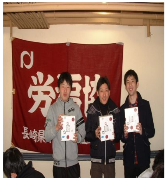
▲優勝チーム「JR九州労組」