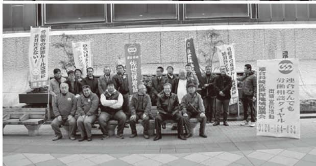
▲佐世保アーケードでのチラシ配布