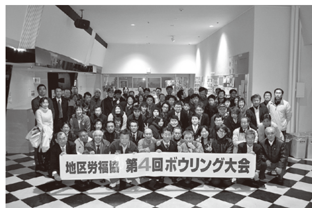
▲佐世保地区労福協第4回ボウリング大会

■佐世保地区労福協は、1月22日(水)18時～西肥シルバーボウルにおいて、標記大会を開催した。大会は県労福協の予選を兼ねており、26チーム90人(応援者含む)の参加者数となり、大いに盛り上がった。