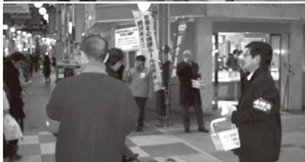
▲長崎アーケード街でのチラシ配布