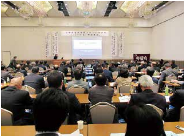
九州各県・沖縄からの参加者

▲中央労福協は、1949年に結成以来、この70年、組織の枠を超えて「福祉はひとつ」という創業精神のもと、すべての働く人たちの幸せと豊かさをめざして、労働者自主福祉運動を推進してきたことから、これまでの活動を振り返るとともに、今後の活動を充実させていくために、11月28日、ホテルラングウッド（東京）において、「中央労福協結成70周年記念レセプション」が開催され、中央労福協加盟団体・行政・政党関係・NPO・市民団体・学識経験者等、400名を超える方々に出席していただきました。