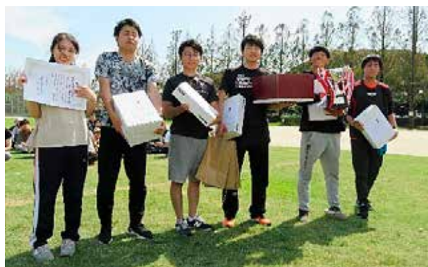
優勝「県北振興局」チーム