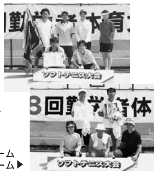
優勝の県職労チーム 準優勝の天理学園教組チーム▶

日時:7月18日(祝) 場所:田原本中央体育館 参加チーム:7チーム 優勝:県職労チーム 準優勝:天理学園教組チーム