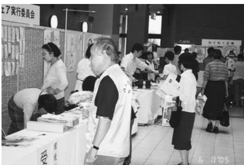
家族連れで賑わう「環境フェア」

8月6日、奈良県と奈良県環境県民フォーラムが主催する「環境フェア」が、～みんなとめよう温暖化～をスローガンに奈良県広域地域産業振興センターで開催されました。