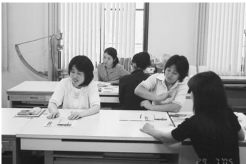
受講のみなさんも和やかに

今年は、受講の先生方と膝を突合せて和やかな雰囲気、時折、ユーモアを交えたやりとりを入れて進められました。受講の先生方からは、父兄の家庭事情に於ける対処の悩み相談や自身が詐欺被害を被りかけた時の経験談交流など、現実の深刻な課題として“クレ・サラ問題”があることが浮き彫りになりました。