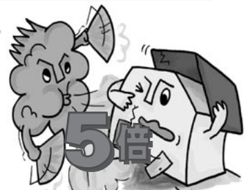
※2003年と2004年の台風上陸数の差