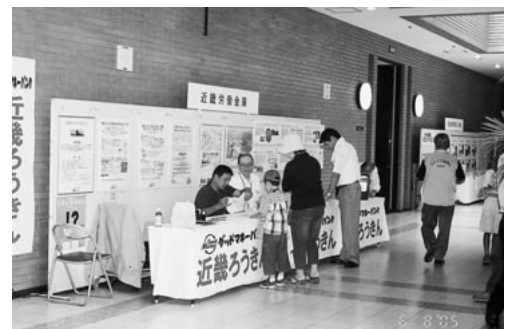
近畿ろうきん“自慢”のブースです