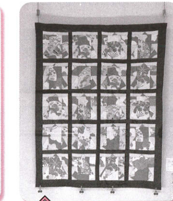
工芸 思い出 娘の産着で 村中 幸代