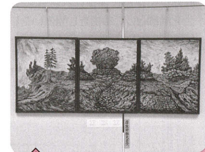
洋画 平群の丘(3の1・2・3) 内田 忠司