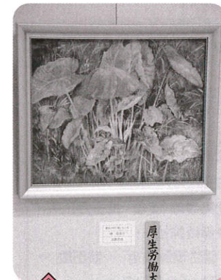
日本画 雑草の中に里いもの花 塚 奈美子