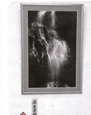
写真 光彩 曾我 敏彦