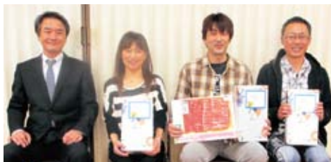
団体戦の部 優勝(別速杵国東地区労福協)