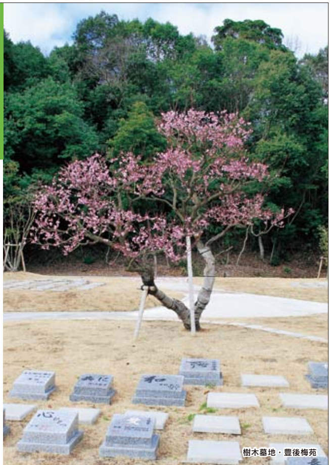
樹木墓地・豊後梅苑