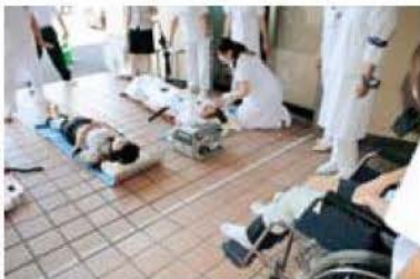
搬出後に人工呼吸器の装着をして避難完了です

また、訓練終了後には防火設備業者担当者から火災報知機と防火扉、非常ベルについての説明を受け、火災発生時の対応を確認しました。