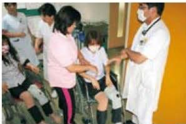
手を組んで車イスの患者を抱えます

入院患者の避難では、人工呼吸器を着けた患者を想定した担送避難と、車椅子患者を想定した護送避難を模擬患者で行いました。担送避難は人工呼吸器の着脱やレスキューボードでの搬出、護送避難は廊下は車椅子で移動、階段では車椅子から患者を降ろし、抱えて搬出するといった一連の手順を実際に行いました。