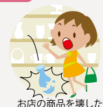
お店の商品を壊した