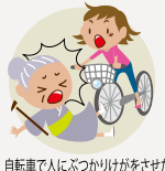
自転車で人にぶつかりけがをさせた