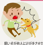
飼っている犬が他人にけがをさせた