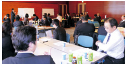
県生協連に加盟する12の生協は、阪神淡路大震災や新潟中部地震、石川県能登地震、福岡県西部地震や3月11日に発生した

ちで守る「共助」、行政による「公助」を基本理念とし、地域社会の防災力を向上させることによつて、被害を最小限におさえる減災社会の実現に向けた「大分県減災社会づくりのための県民条例」が制定され、平成21年4月1日から施行され、今回の東日本大震災を受けて、津波対策を中心とした大分県地域防災計画の見直しの素案が作成され、関係者への説明が行われました。