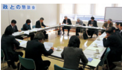
演習②では、「シミュレーション（発災2日～3日目の対応）」で、通信手段など一定インフラが回復したとき、生協は組合員のいのちと暮らしを守ると同時に社会的な責任として、様々な支援活動を行政や取引先、あるいは生協間で連携しながらすすめる必要があります。

演習①では、「クロスロードゲーム」で、災害はいつ、どのようなどころでも発生しえます。一旦災害が発生するとその復旧までには、予測困難な様々な事象が発生し、その一つひとつについて意思決定をし、実行しなければなりません。「クロスロードゲーム」は、このような意思決定の帰路に立つたとき、組織の目標を達成するため、より効果的な判断ができるように訓練するツールで、今回の東日本大震災で宮城生協が経験した実例により10題の設問を用意して、参加者個人の判断をだしあい、グループとして結論を出せるように進めました。