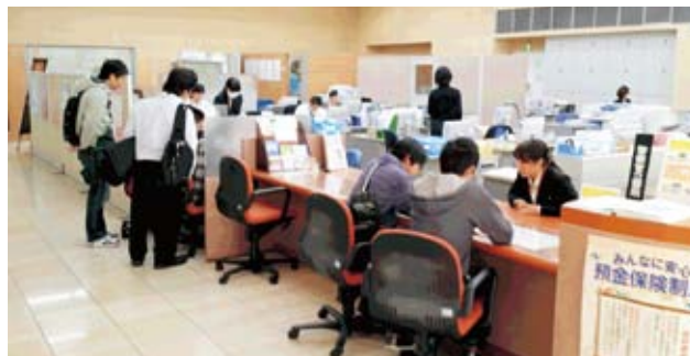
リアル・オリエンテーリングの様子(2015年2月12日)

また、2月22日(日)には「お金の話」と題して、子どもたちへインターネット・携帯電話などのゲーム(課金)についての知識や悪徳商法についてなど九州ろうきんの職員が寸劇を交え、社会人としてのお金に対する心構えを伝授しました。