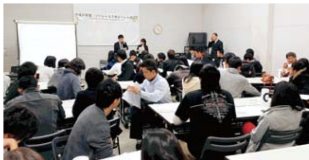
金融学校の様子(2015年2月22日)

知らないとソンをする?! 街のATMの利用手数料が 無料になる、 ろうきんカード。