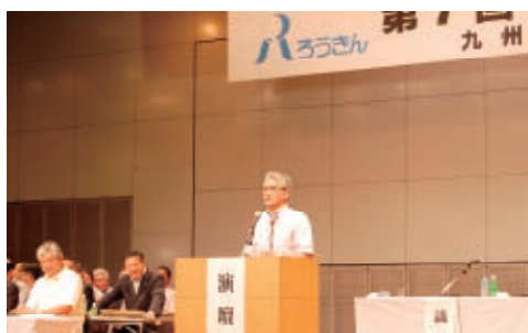
退任・閉会のあいさつを行っている南県本部長

「人々が喜びをもつて共生できる社会への実現に寄与する」ために、経営環境が変化しても一定の収益が得られる安定した経営基盤を確立します。