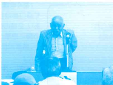
福島議長(小城多久地区代議員)