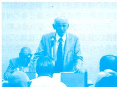
佐賀県友の会 カ久会長