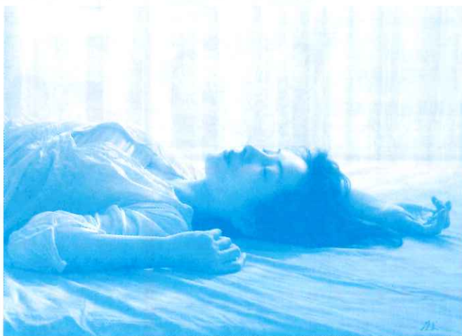
「目射し」(部分)島村信之 2009年