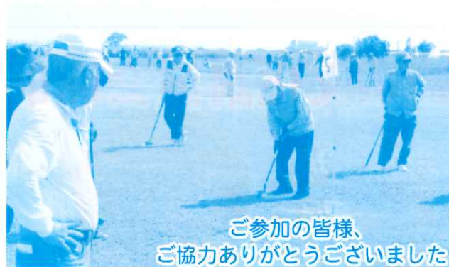
ご参加の皆様、 ご協力ありがとうございました