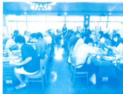
日田森ビール園にて昼食