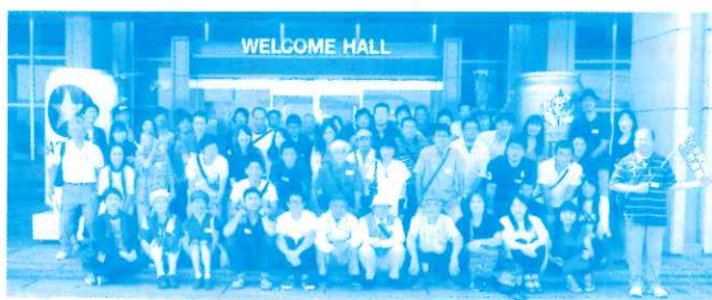
サッポロビール九州工場見学

サッポロビール九州工場見学をし、日田の名水を使っ てのこだわりの製法と技術を体感する事が出来ました。 バーベキューを楽しんだ後、九州の小京都と呼ばれる日 田市豆田町の散策を行いました。