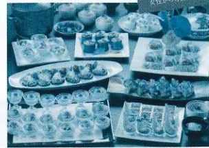
※料理内容は一部変更となる場合がございます。

料理+2時間飲み放題付プラン 10名様以上のご宴会プランもご用意しております 7,500円/8,500円/10,000円