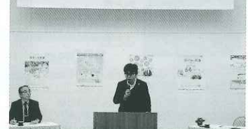
こくみん共済coop 佐賀・神埼地区推進会議

2020年1月17日～31日にかけて、県内9地区で「2019年度第2回地区推進会議」を開催しました。2019年度下半期(2019年12月～2020年5月)の主な取り組み、ならびに、こくみん共済とマイカー共済の推進についてご提案を行いました。協力団体の皆さまと一緒に、組合員の可処分所得の向上を目的とした活動・万一の際の暮らしを守る保障点検活動を共創の取り組みとして、より強化して展開することを確認いたしました。