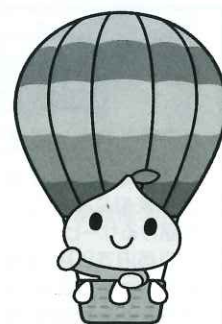
佐賀バルーン ビットくん