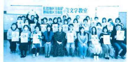
昨年11月に開催した「美文教室」

会員皆さまの安全・安心を第一優先に活動を行って参りますので、ご理解とご協力をお願いいたします。