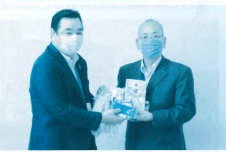
▲ なわとびの寄贈式(7月16日 於:佐賀市役所)の様子