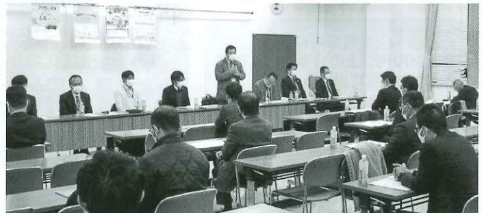
▲ 佐賀・神埼地区合同推進会議