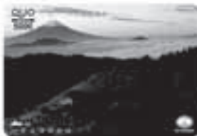
No.509 紅の山稜 〈撮影地〉 大月市 白谷丸