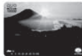
No.1006 雨上がり 〈撮影地〉 山伏岳