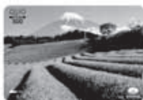
No.24 茶畑の空高く 〈撮影地〉 富士市