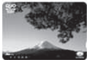
No.309 紅に燃える 〈撮影地〉 河口湖畔