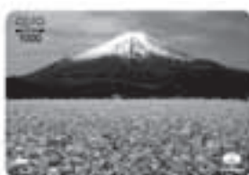
No.119 花菜畑 (はななばた) 〈撮影地〉 富士宮市