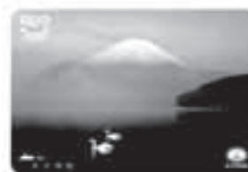
No.208 朝もやの時 〈撮影地〉 山中湖